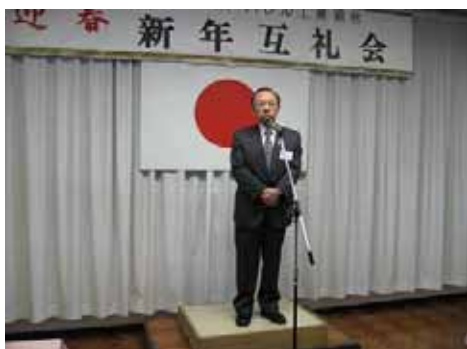
(挨拶される平県会議員)