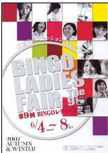
《第9回のパンフレット》

協議会への参加企業は、アパレルアイ(株)、(株)アパレル・ウラベ、アリフク(株)、有木(株)内田太郎商店、(株)鎌倉、(株)川原センイ、(株)佐々木要右衛門商店、(株)大盛センイ、田邊(株)田和被服(株)、(株)塚孝市商店、(株)ツースリー被服、ツトム商事(株)、戸田被服(株)、(株)ナツメダ藤川(株)、富士ドレス(株)、(株)ポレー、丸栄被服(株)、(株)山武商店、(株)山名繁治郎商店、山和(株)由永縫製の24社です。