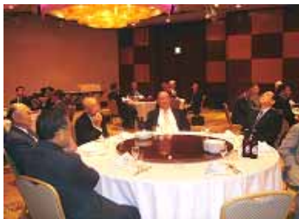
総会及び懇親会風景