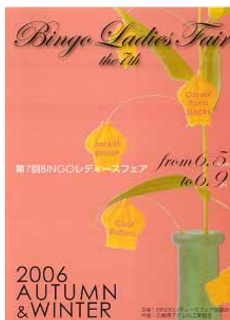
《第7回のパンフレット》