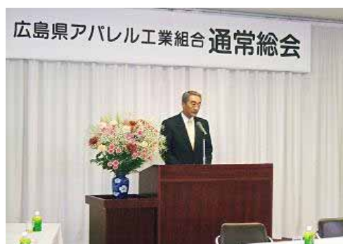
門田福山市経済部長様